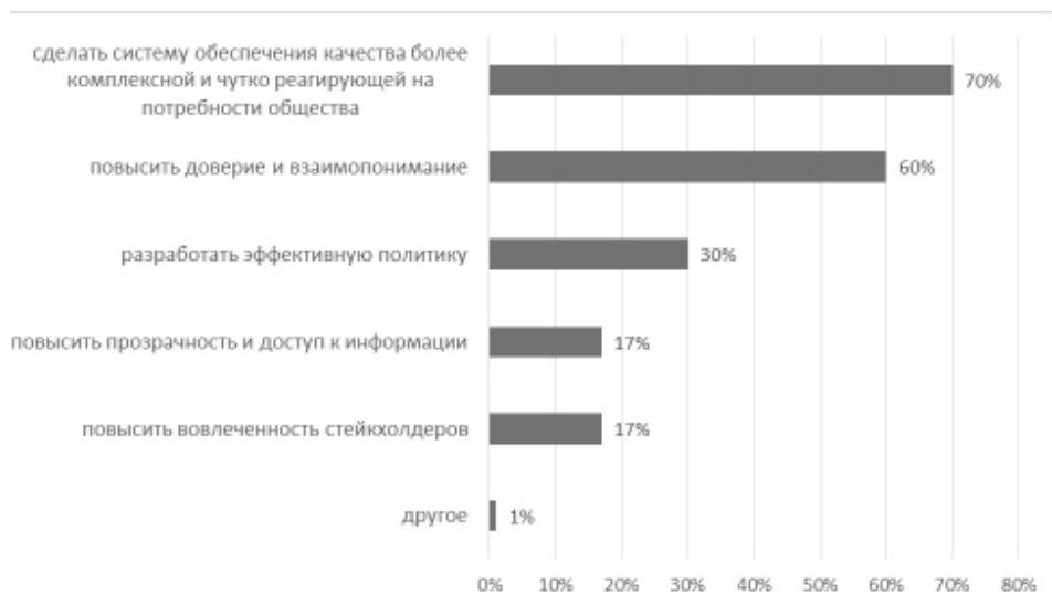
Диаграмма 2. Цели, которых агентства стремятся достичь посредством привлечения заинтересованных сторон к внешней оценке качества (% агентств) [8]

В ходе опроса у респондентов также интересовались, какие практики оценки