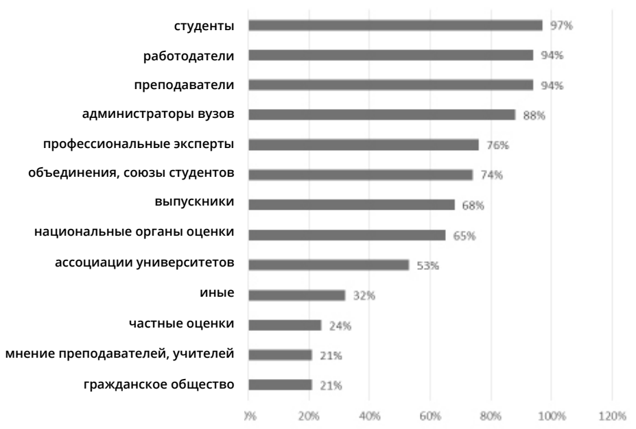
Диаграмма 1. Участие заинтересованных сторон во внешних процессах и мероприятиях по обеспечению качества агентств ЕС (% агентств) [8]

На основе результатов опроса, проведенного Европейской ассоциацией оцен-